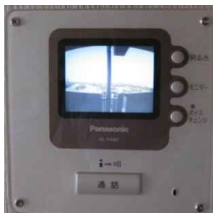
室内モニター部分