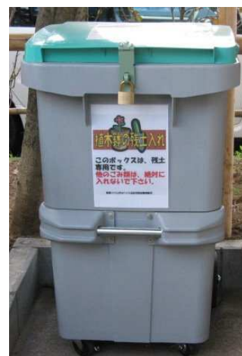
▲残土ボックス外観▲