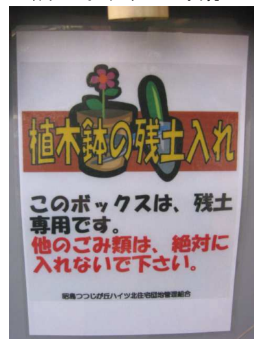
▲使用ルールをお守りください▲