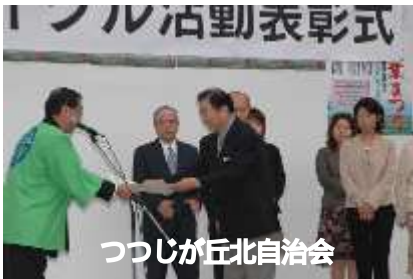
つつじが丘北自治会

つつじが丘北自治会とアゼリア子ども会は、11月11日(土)から開かれた第38回昭島市産業まつりにおいて、昭島市より日頃のゴミ減量活動に対し表彰されました。これも住民の皆様の日頃からのゴミ分別、資源ゴミ回収に協力して頂いたたまものであると感謝しております。ありがとうございました。