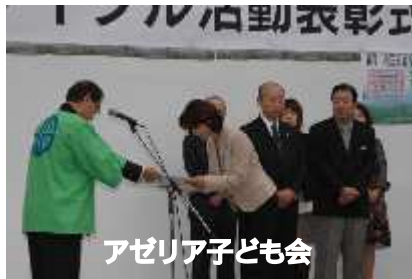
アゼリア子ども会