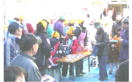
子ども会&シニアクラブの皆さんが協力▲