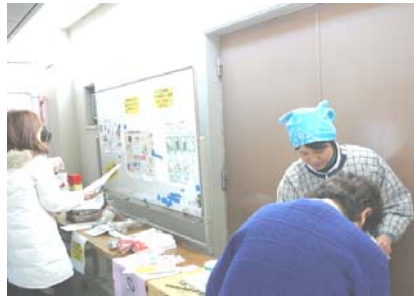
▲ゴミ分別展示コーナー