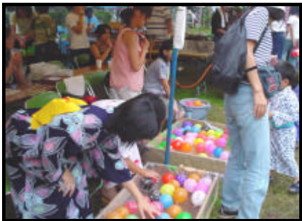
きれいな風船から先に売れました

自治会では常日頃、子供達が自分の“ふる里”として、この昭島つつじが丘の地を誇りに思えるようにしたいと願っていますが、祭りは確かにその役割を担っていると感じます。来年もまた楽しみましょう。