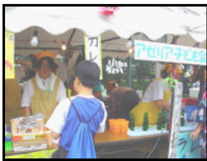
お母さん達も大忙しの日でした