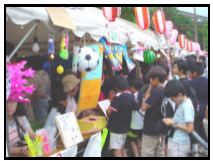
くじびき店も大繁盛!!