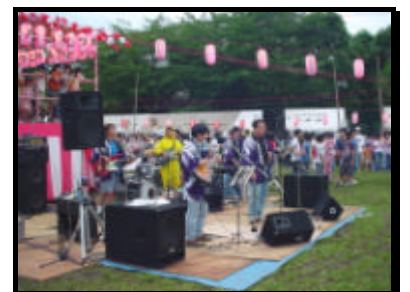
親父バンドも大熱唱!!

夏休みには子供達が活発に戸外で活動する時期でもあり、また多くの方が、旅行や帰省などで家を留守にされることも多いと思います。被害に遭わないよう日頃から注意すると同時に、多くの人目を周辺に注いでいくことも重要です。自治会、管理組合では週末に団地内のパトロールを実施していますが、限界があります。事故を未然に防ぐためにも不審者を見かけられたら迷わず警察に通報をお願いします。ご協力をお願いします。